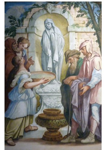
Padova, Palazzo Cavalli, sala delle Storie Romane Michele Primon, seconda metà XVII secolo